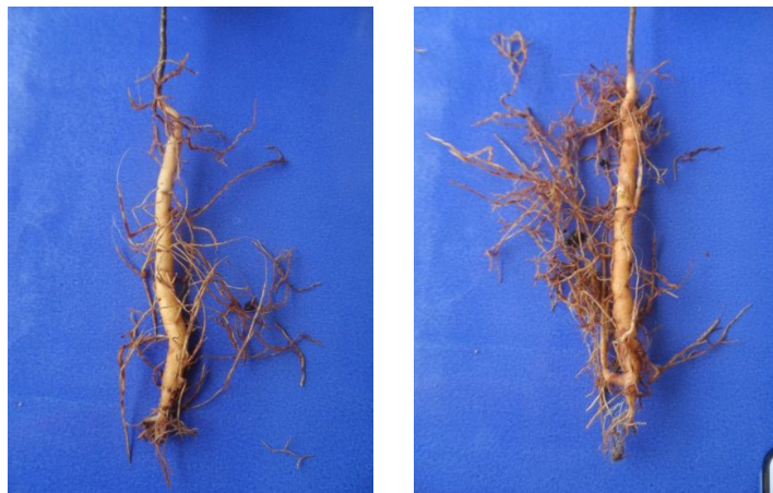
C - Intermitente