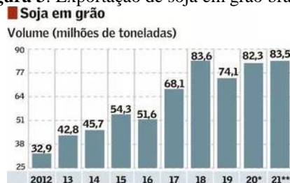
Figura 3: Exportação de soja em grão brasileira